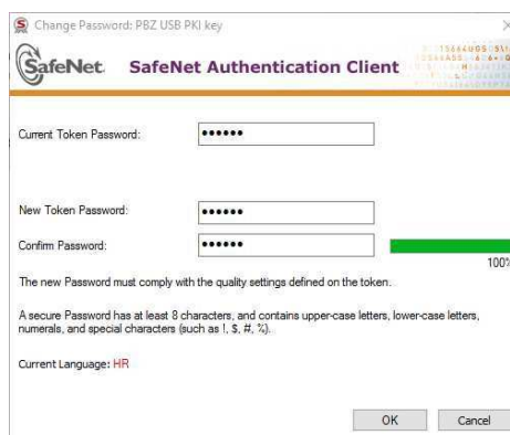
Slika 7 – Ispravno popunjeni podaci za promjenu PIN-a