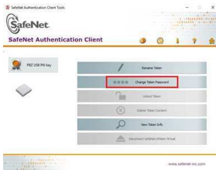
Slika 5- Odabir opcije za promjenu PIN-a