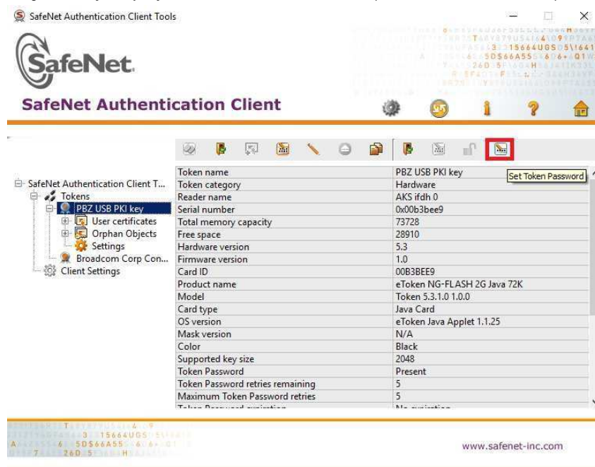
Slika 11 - Pokrenite SafeNet Authentication Client Tools