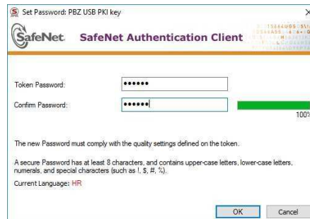
Slika 13- Ekran za unos novog PIN-a