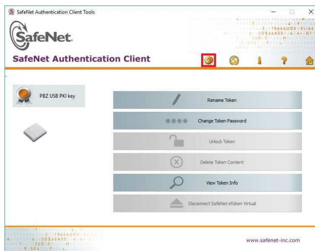
Slika 10 - Odabir Advanced view-a