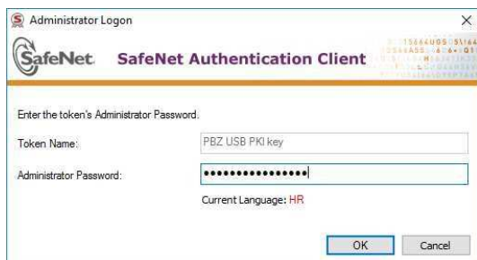
Slika 12- Ekran za unos kôda za otključavanje (unlock code)