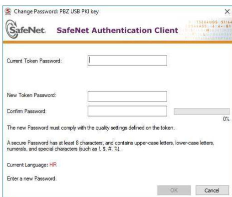
Slika 6- Ekran za promjenu PIN-a